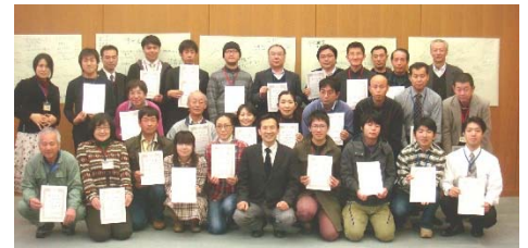
写真: 千葉県グリーン・ブルーツーリズム担い手養成塾として、過去10年間継続して成果の活用と普及により人材育成(修了生とともに本人中央)

都市農村活動の発展段階プロセスを、実証的に解明した。初期段階は、「地域の自信を醸成」から、「内外の人的ネットワークの形成拡大」を経て、新たなアイデアの実施段階に至ることを解明。