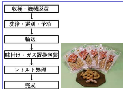
レトルト落花生の製造フローと レトルト落花生「郷の香」