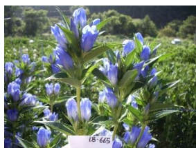
倍加半数体を利用した品種「安代の秋空」