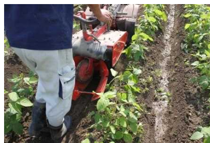
写真2 歩行型耕うん機での作業（7月1日）