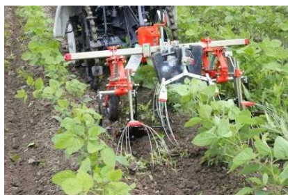
写真1 小型乗用管理機+除草カルチ（7月1日）