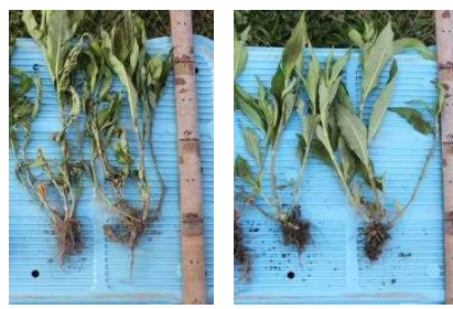
写真4 除草カルチで引き抜けたイヌタデ（左）と引き抜けなかったイヌタデ（右）（7月1日）