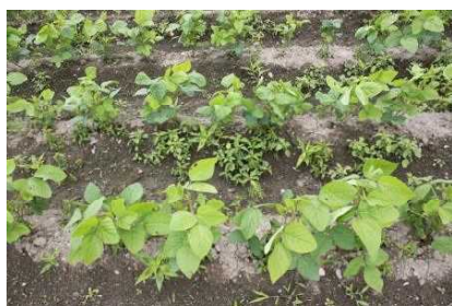
写真3 中耕作業前のうねの状況（7月1日）