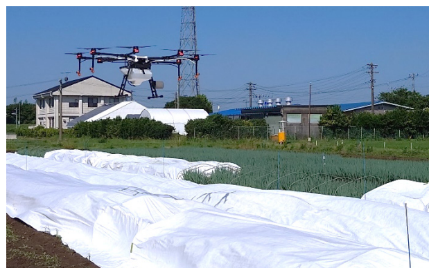
農業用ドローンによる薬剤散布