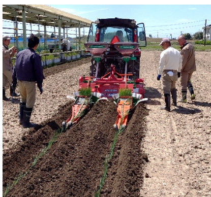
アップカッターロータリ、2連溝底整形機による定植作業