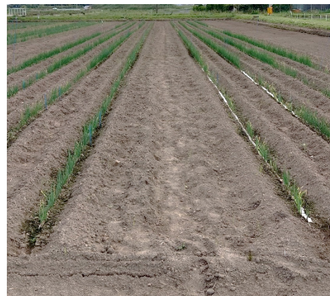
定植約1か月後の 左手前が高-通常区 右手前が高-アップ区