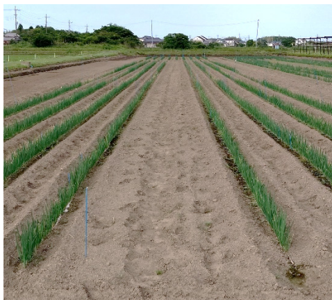
定植約1か月後の 左手前が低-アップ区 右手前が低-通常区