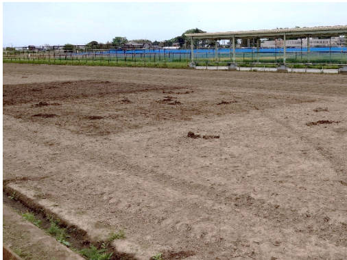
左から土壌水分高、中、低区(耕うん前)